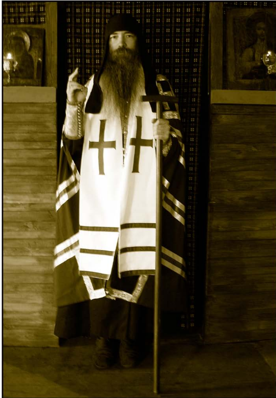
АЛИМПИЙ (ВЕРБИЦКИЙ) СТАРООБРЯДЧЕСКИЙ ЕПИСКОП МОСКОВСКИЙ ДРЕВЛЕПРАВОСЛАВНОЙ ЦЕРКВИ ХРИСТОВОЙ БЕЛОКРИНИЦКОЙ ИЕРАРХИИ